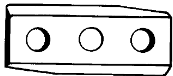
Ref : 2257 (no.5) Kuris BOM30, 40, 60, 80, 100, KRH 071.220.330