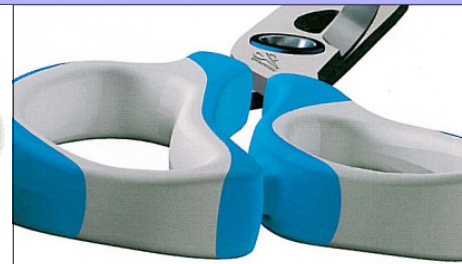
Ergonomisch handvat-Poignée ergonomique-Ergonomic handle