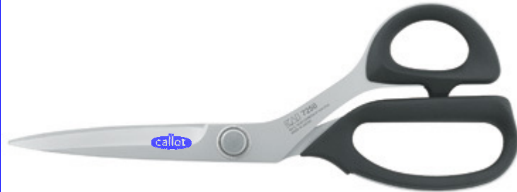
Ref : 7250-10"/ 250mm.