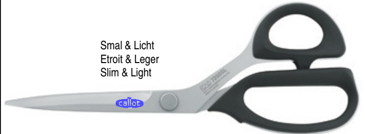
Ref : 7250 SL-10"/ 250mm.