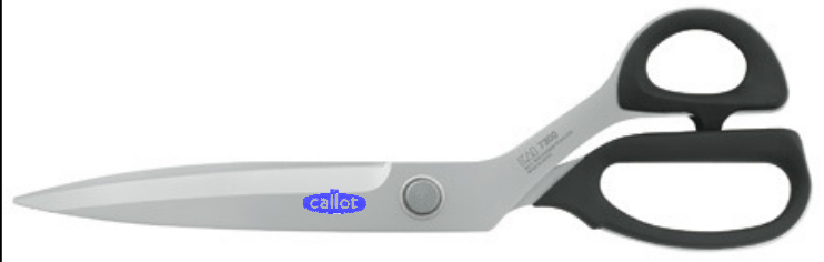
Ref : 7300-12"/ 300mm.