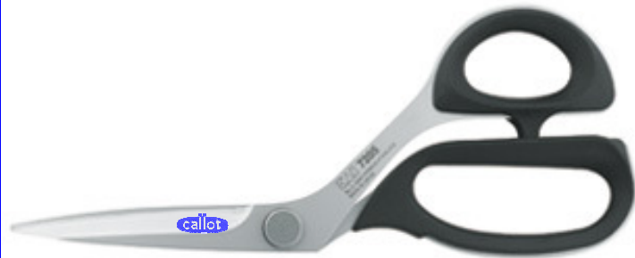
Ref : 7205-8"/ 205mm.

La série 7000 est le ciseau de couture professionnel de nouvelle génération. Les lames sont en acier inoxydable et ont une épaisseur de 3,7-4mm. Les ciseaux présentent une élégante surface mate anti-réverbération et ont un dispositif de fixation breveté "duplex interlock", qui ne se desserre pas facilement.