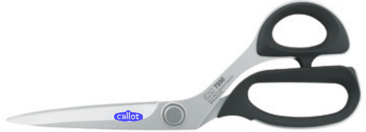
Ref : 7230-9"/ 230mm.